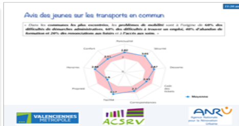
Extraits du support de présentation de l'enquête