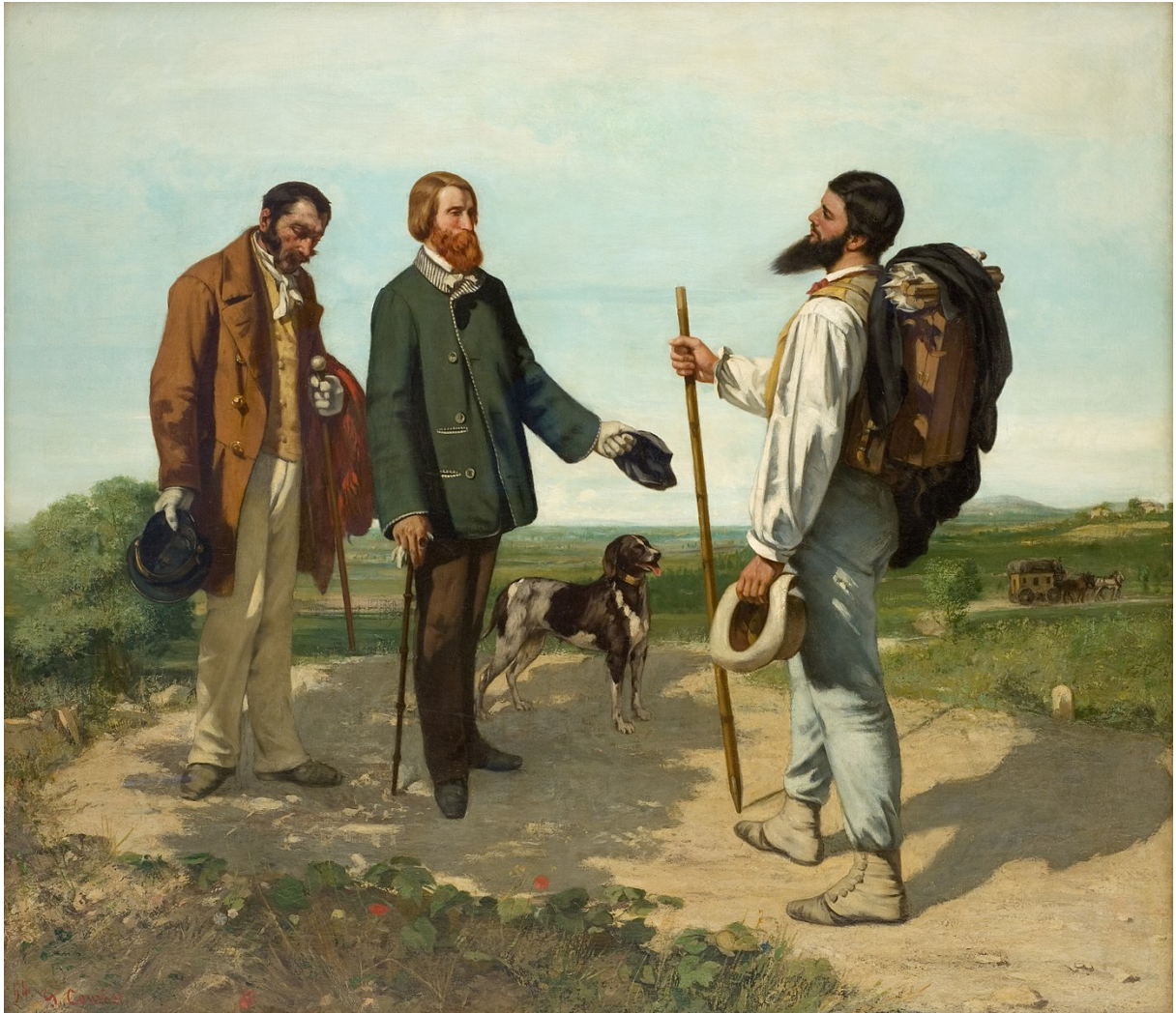
C. À propos d'habitants : « Bonjour Monsieur Courbet », par Gustave Courbet, 1854.