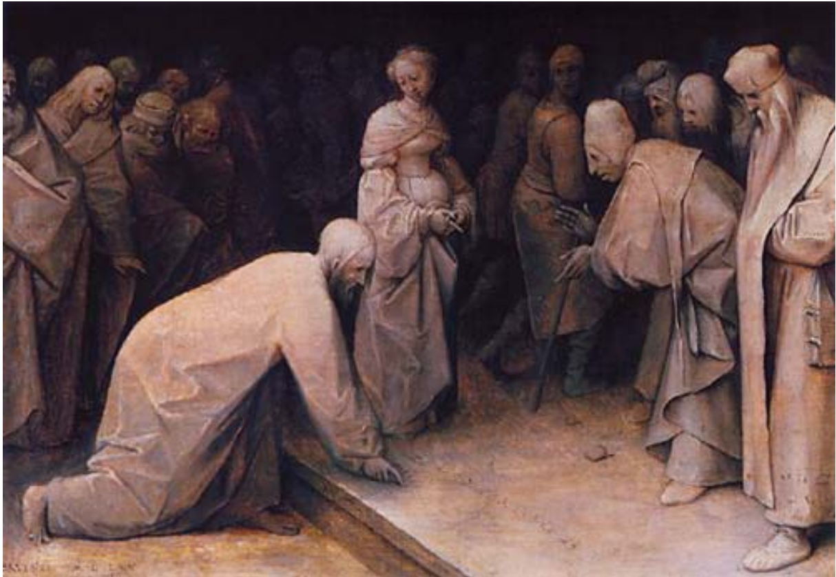
Le Christ et la femme prise en état d'adultère, Pierre Bruegel l'ancien (1565)

8. En ce temps-là, Jésus s'en alla au mont des Oliviers. Dès l'aurore, il retourna au Temple. Comme tout le peuple venait à lui, il s'assit et se mit à enseigner. Les scribes et les pharisiens lui amènent une femme qu'on avait surprise en situation d'adultère. Ils la mettent au milieu, et disent à Jésus : « Maître, cette femme a été surprise en flagrant délit d'adultère. Or, dans la Loi, Moïse nous a ordonné de lapider ces femmes-là. Et toi, que dis-tu ? ». Ils parlaient ainsi pour le mettre à l'épreuve, afin de pouvoir l'accuser. Mais Jésus s'était baissé et, du doigt, il écrivait sur la terre. Comme on persistait à l'interroger, il se redressa et leur dit : « Celui d'entre vous qui est sans péché, qu'il soit le premier à lui jeter une pierre. » Il se baissa de nouveau et il écrivait sur la terre. Eux, après avoir entendu cela, s'en allaient un par un, en commençant par les plus âgés. Jésus resta seul avec la femme toujours là au milieu. Il se redressa et lui demanda : « Femme, où sont-ils donc ? Personne ne t'a condamnée ? » Elle répondit : « Personne, Seigneur. » Et Jésus lui dit : « Moi non plus, je ne te condamne pas. Va, et désormais ne pèche plus. »