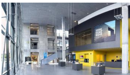
Rubika occupe un lieu dédié à la création numérique.