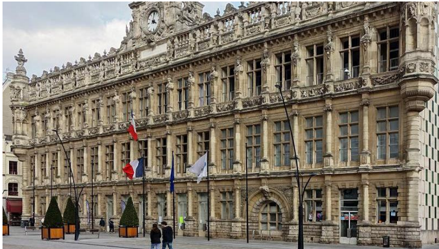
Hôtel de Ville de Valenciennes.

Par Jean-Marc De Jaeger Le Figaro.fr 18/11/2016