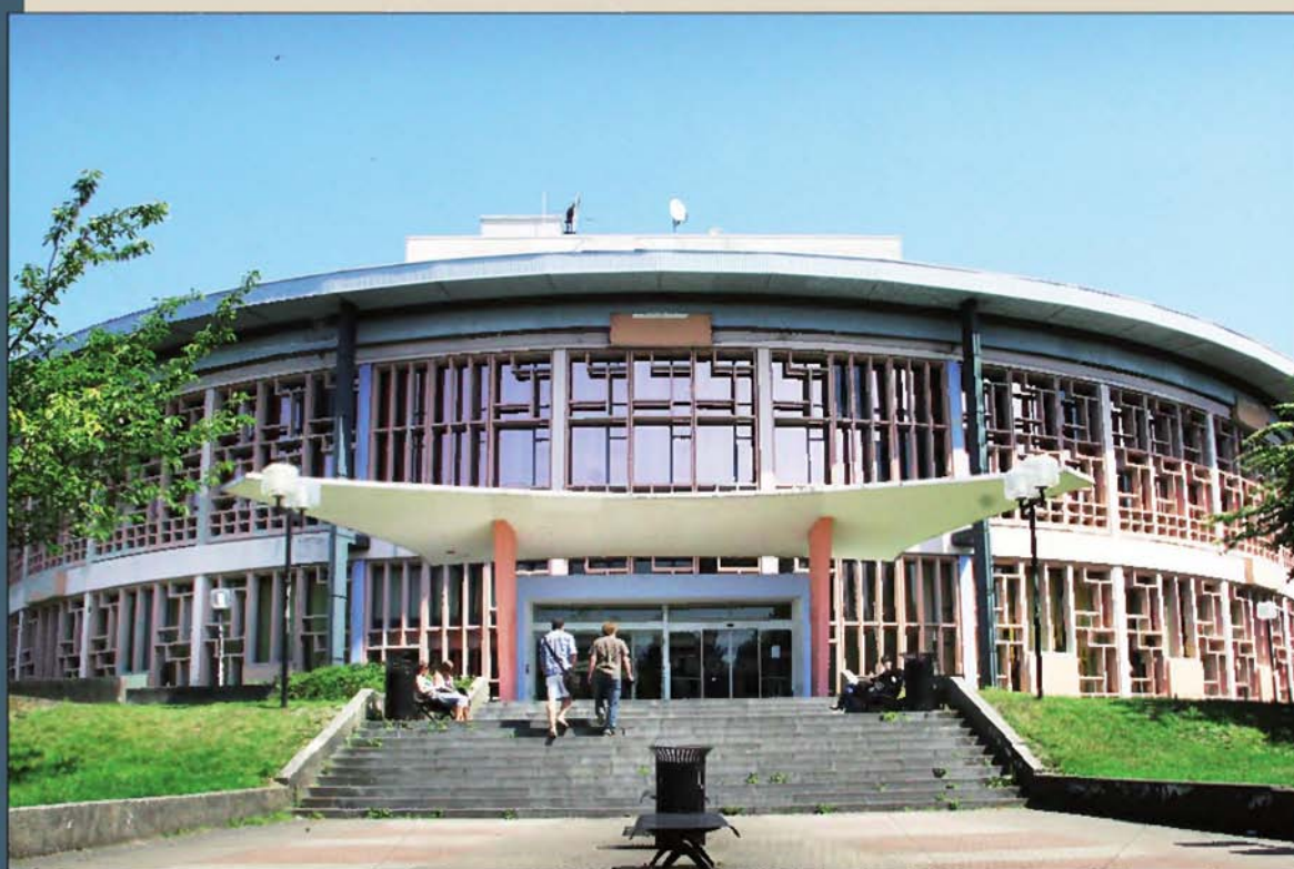
Université de Lille 1 (Nord). Son master management des ressources humaines a été remarqué dans les classements internationaux.