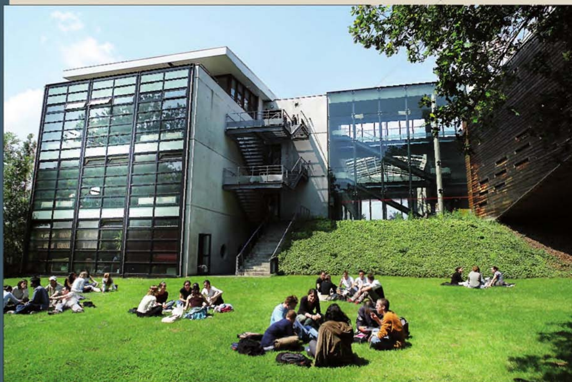
Université de Marne-la-Vallée (Seine-et-Marne). L'UPEMLV est la première fac en France en matière d'apprentissage.

► Ses points forts Avec 2 300 apprentis, soit 22% des inscrits, l'UPEMLV, très axée sur la professionnalisation, reste la première université de France en matière d'apprentissage. La recherche n'est cependant pas en reste, avec un pôle d'excellence de premier ordre dans le domaine de la ville et de l'environnement. F. W.