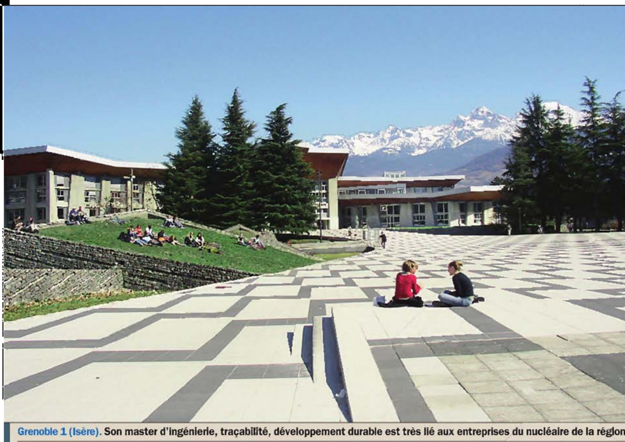
Grenoble 1 (Isère). Son master d'ingénierie, traçabilité, développement durable est très lié aux entreprises du nucléaire de la région.

► Ses points forts En 2009, la fac a ouvert une école destinée aux bacheliers professionnels, qui a accueilli 30 étudiants en 2010 et table sur un effectif de 75 pour 2011. Les différentes promotions sont parrainées par des industriels, tels Schneider Electric ou Orange. Autres cursus innovants : des formations positionnées aux interfaces des domaines sciences et technologies, en lien avec les professions de santé, comme les masters de la mention « Ingénierie pour la santé et le médicament ». A. D.