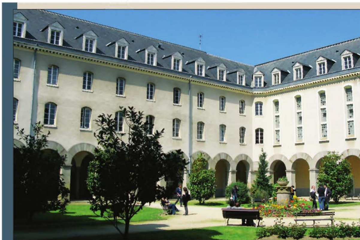
Université de Rennes 1 (Ile-et-Vilaine). Tournee vers l'Asie, la fac possède un centre de management franco-japonais.