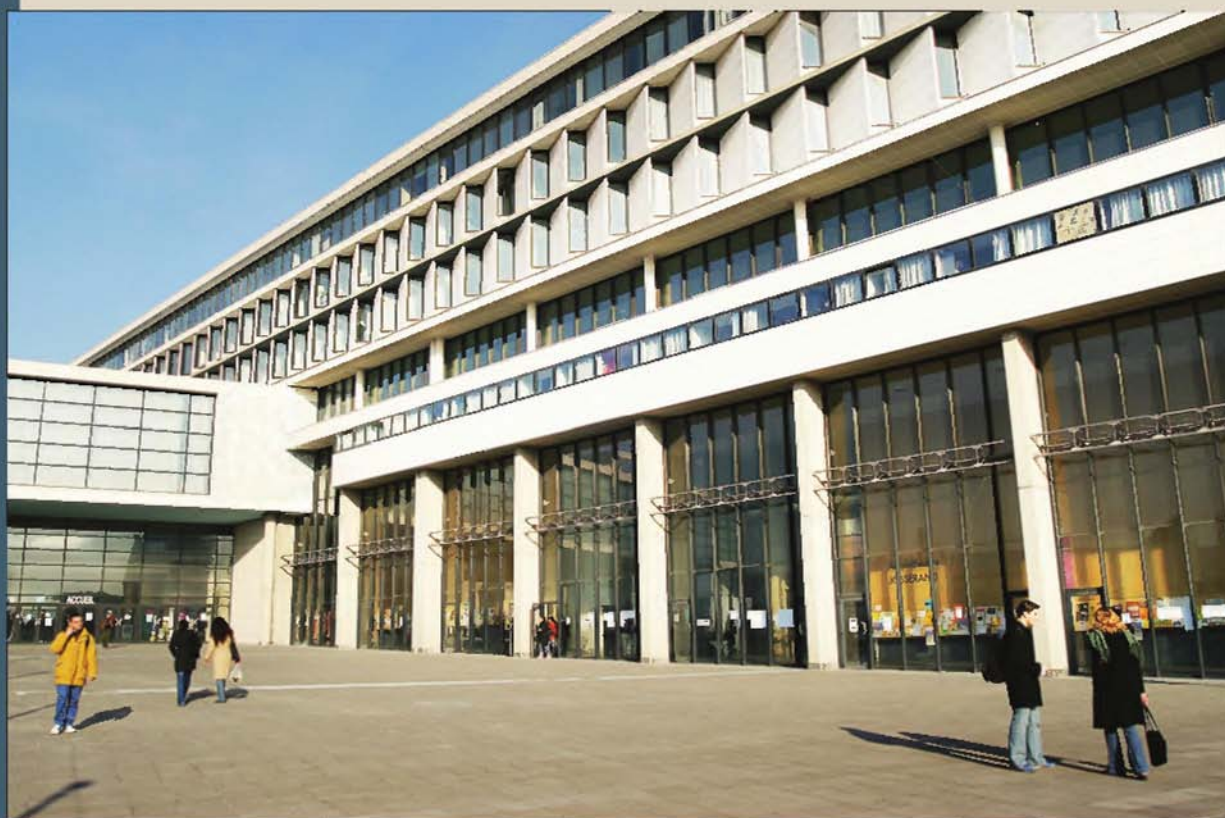
Université de Cergy-Pontoise (Val-d'Oise). Des cursus très professionnels, comme celui de gestion des risques financiers.

► Ses points forts Cergy offre quelques pépites, en droit et éthique des affaires, en gestion des risques financiers ou en gestion des instruments financiers par exemple. Autre belle carte de visite pour les étudiants en lettres et sciences humaines : le master en management et ingénierie des services à l'environnement proposé avec l'Ecole nationale des ponts et chaussées. Fanny Weiersmuller