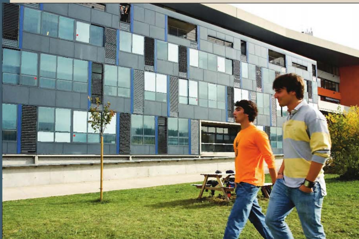
Université Clermont-Ferrand 1 (Puy-de-Dôme). Son pôle développement international forme des cadres de l'OMC et du FMI.