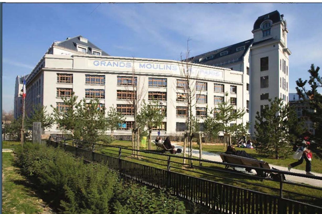
Université Paris 7-Diderot. La fac a mis au point un programme de mobilité internationale dès la première année.

► Ses points forts En plus de nombreux doubles diplômes, Paris 7 a mis en place un programme de mobilité internationale dès la première année. Les candidats au départ suivent des stages intensifs de langues et les étudiants étrangers sur le campus jouent les tuteurs. F. W.