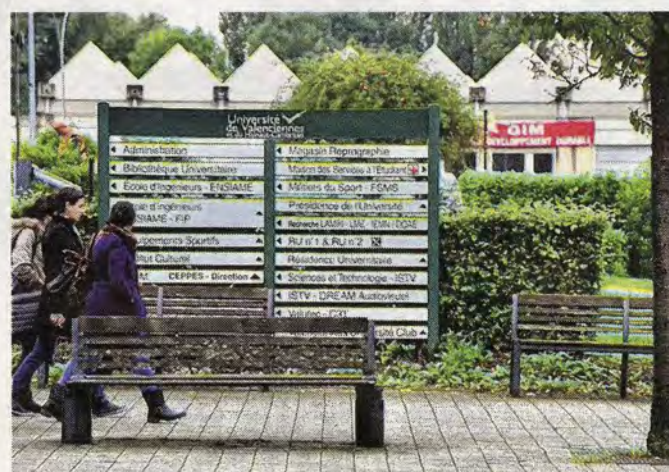
Deux gros points noirs pour les étudiants : le transport et les sorties nocturnes.

universitaire prévue pour la rentrée 2017, dans le cadre du Technopôle. Autant d'éléments, qui, s'ils sont pris en compte, finiront peut-être par faire grimper Valenciennes dans le palmarès du magazine. ■