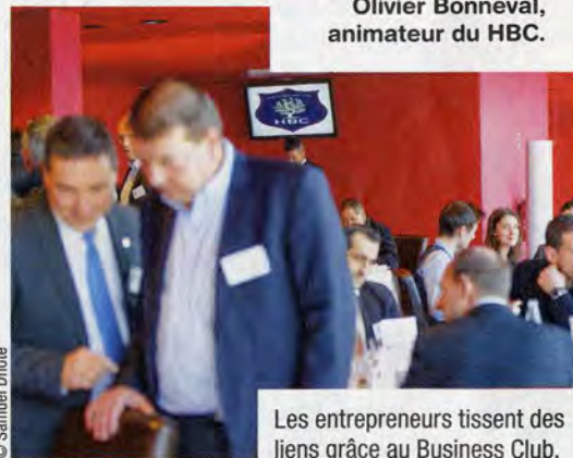
Les entrepreneurs tissent des liens grâce au Business Club.