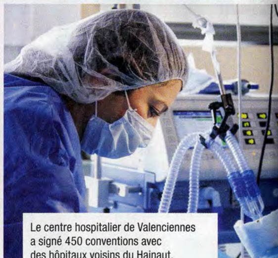
Le centre hospitalier de Valenciennes a signé 450 conventions avec des hôpitaux voisins du Hainaut.

BASSIN DE VIE Que ce soit pour aller travailler, se former ou se soigner, la vie quotidienne ou économique dépasse les frontières des 35 communes de la communauté d'agglomération de Valenciennes Métropole et s'organise à l'échelle du Hainaut-Cambrésis.