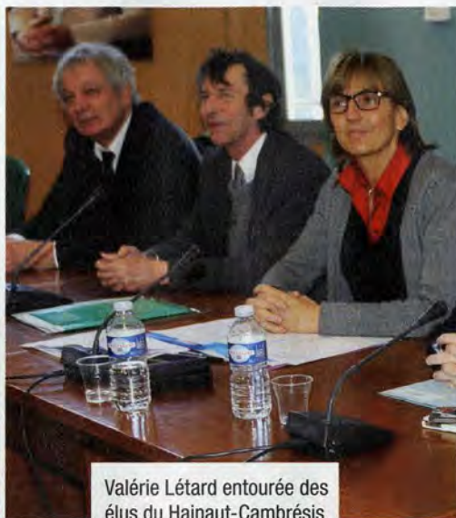
Valérie Létard entourée des élus du Hainaut-Cambrésis