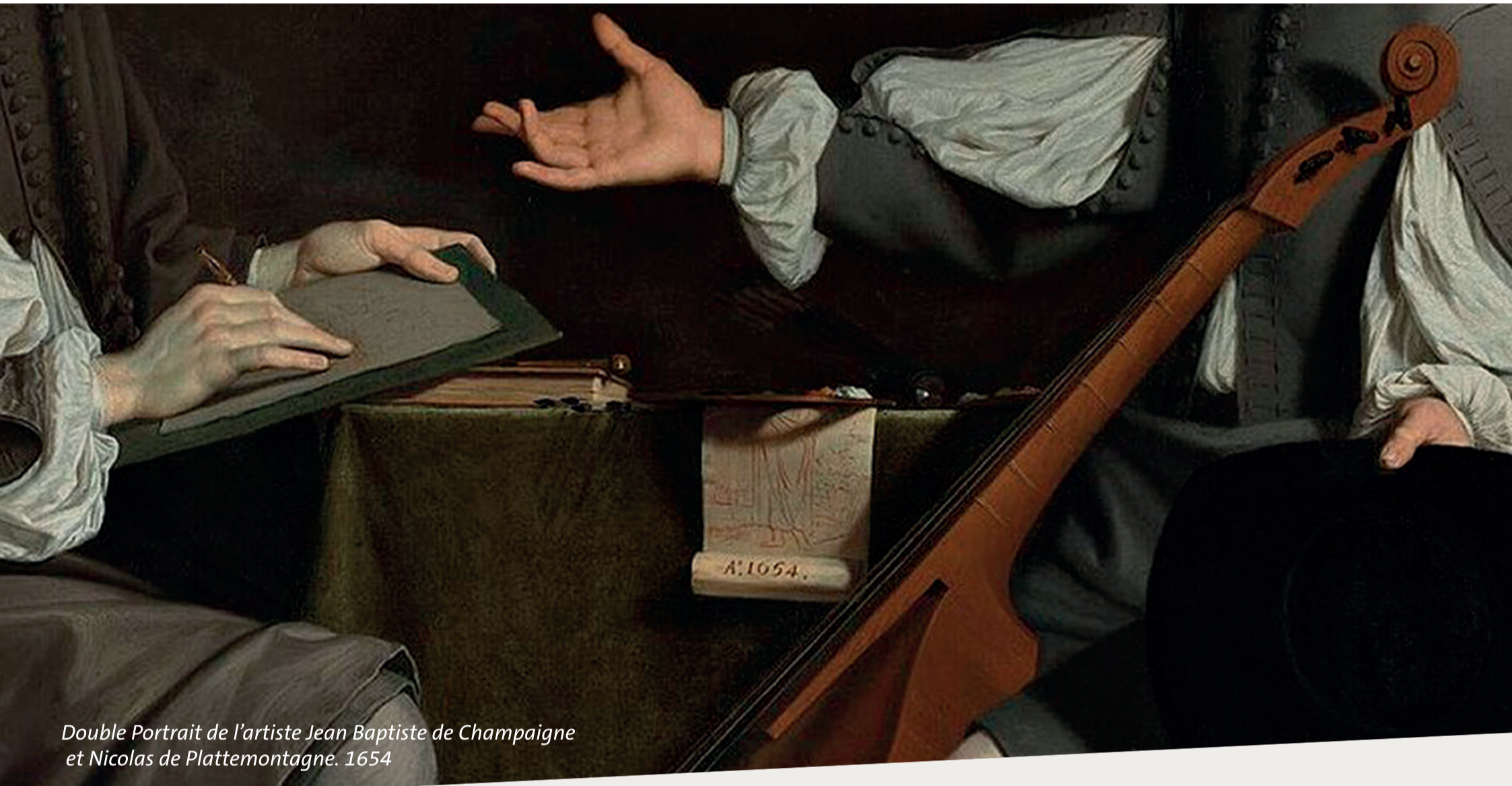
Double Portrait de l'artiste Jean Baptiste de Champaigne et Nicolas de Platemontagne. 1654