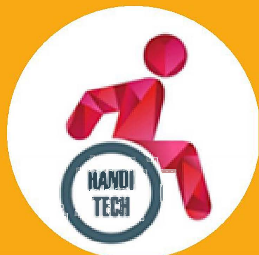
Table ronde « Du besoin au produit »