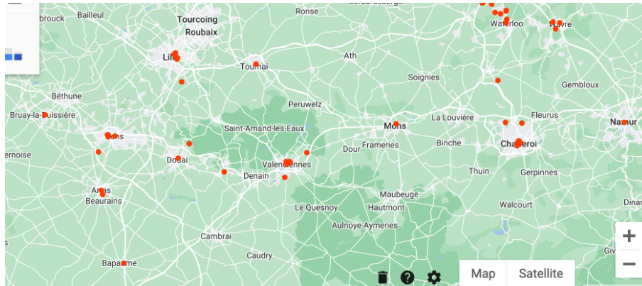
Travail de terrain : lieux de séjour/observation, avril 2022.