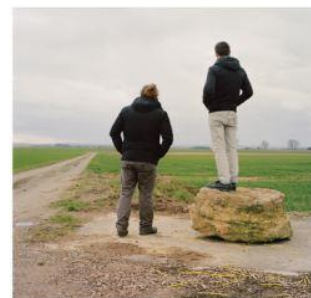
ON N'EST PAS DES ROBOTS OUVRIÈRES ET OUVRIERS DE LA LOGISTIQUE